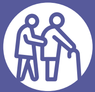
FIGURA #5 ATENCIÓN Y REFERENCIA DE ADULTOS MAYORES