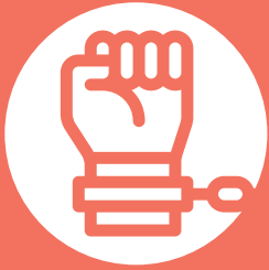
FIGURA #6 ATENCIÓN DE PERSONAS VULNERABLES VÍCTIMAS DE TRATA