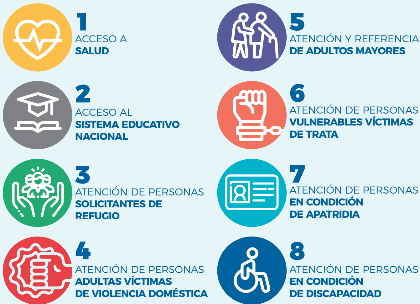
Figura 1. Flujos de Referencia Priorizados

Los flujos priorizados son los siguientes: