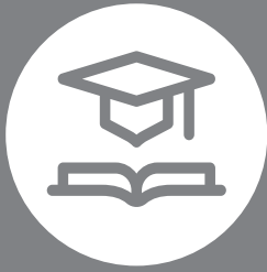
FIGURA #2 ACCESO AL SISTEMA EDUCATIVO NACIONAL

(PREESCOLAR A SECUNDARIO) PARA MENORES Y MAYORES DE EDAD.