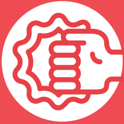
FIGURA #4 ATENCIÓN DE PERSONAS ADULTAS VÍCTIMAS DE VIOLENCIA DOMÉSTICA