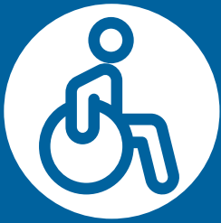
FIGURA #8 ATENCIÓN DE PERSONAS EN CONDICIÓN DE DISCAPACIDAD