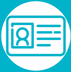
FIGURA #7 ATENCIÓN DE PERSONAS EN CONDICIÓN DE APATRIDIA