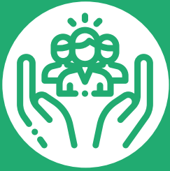
FIGURA #3 ATENCIÓN A PERSONAS SOLICITANTES DE REFUGIO