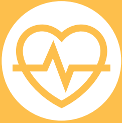
FIGURA #1 ACCESO A LA SALUD